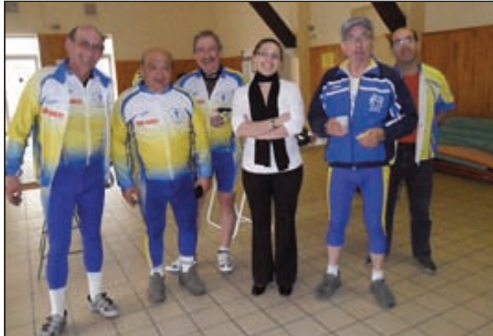
Un beau trio va recevoir une coupe à la Rando du printemps à Targon.