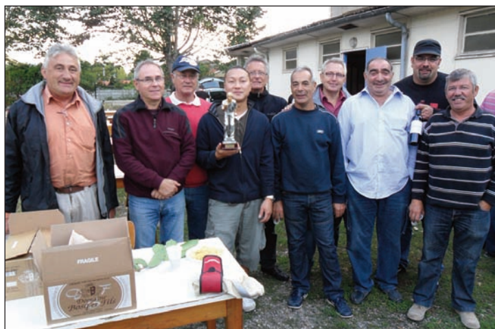
Les participants, ici lors de la coupe interpro, repartent toujours avec des lots et parfois de beaux trophées.

Cette imitation de l'accent spécifique de la rive droite fait partie des usages. On a beau parodier pour se donner du cœur à l'ouvrage et parier sur l'apéro ou la Fanny, contrefaire le Raimu furibard, le Fernandel goguenard, on le sent bien : il faut se résigner au deuxième degré, car on n'a pas le style Pro. Non, nous ne maîtrisons pas cet accroupissement confortable du premier pointeur, les genoux écartés, méditant le bon chemin en faisant tressauter la boule dans sa main recroquevillée. Pas non plus, ce silence qui précède les hautes œuvres du tireur, où on ressent comme un risque incertain. D'ailleurs, on ne joue pas à la pétanque, mais aux « boules ». Pour un « bec surprise », un carreau stupéfiant, combien d'approches molles à un mètre du cochonnet (voire beaucoup plus...), de tirs kamikazes enlevant la boule qu'on ne visait pas ! » (chacun se reconnaîtra...!).