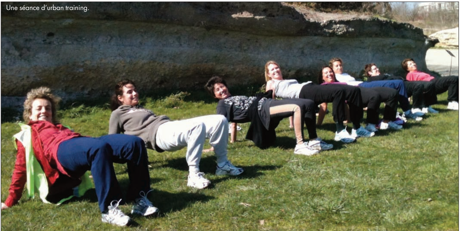
Une séance d'urban training.

Renseignez-vous auprès de Pascale CHAUSSAT (service Communication) au 05 35 31 34 46 ou par mail : p.chaussat@sudouest.fr