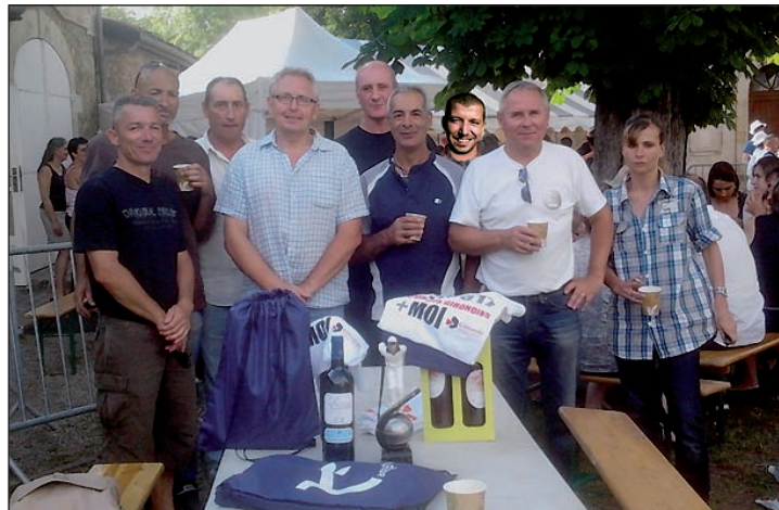
La section Pétanque de la Page Blanche bien représentée à Sarcignan.

Lors de notre assemblée générale du 17 janvier, nous avons