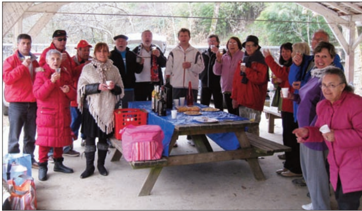
Fidèle pique-nique à Verdélais.

Bazas-Langon (4 mars) : Marches de 11 et 17 km, courses de 11 et 21 km, 21 participants pour ce 1 er