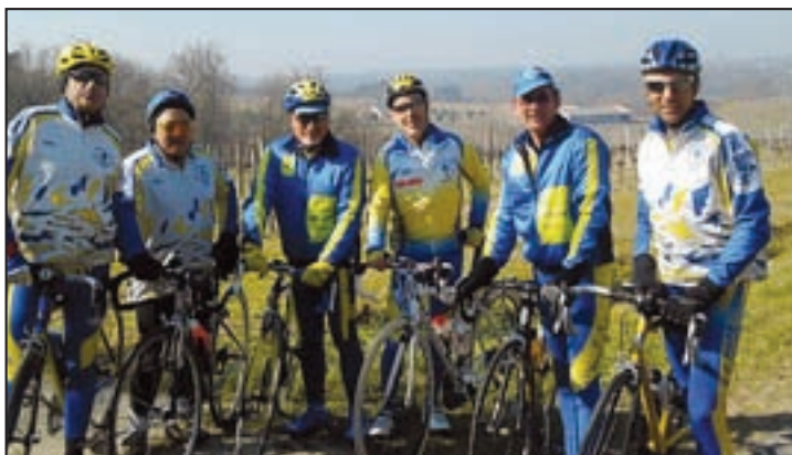
Sur les hauteurs de Pompignac lors d'une sortie en semaine en mars 2012.

nouvelle édition de la Traversée des Baronnies dans la région de Bagnères avec là aussi la présence de dix adhérents et nous en avons profité pour faire un petit week-end montagnard. Nous avons été représentés éga-