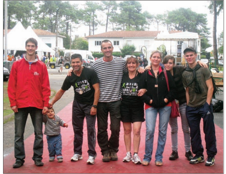
Marche, duo et marathon à Lège-Cap-Ferret.

grand rendez-vous de la saison, avec son incontournable semi-marathon, course devenue très rare dans la région avec la multiplication des courses « na-