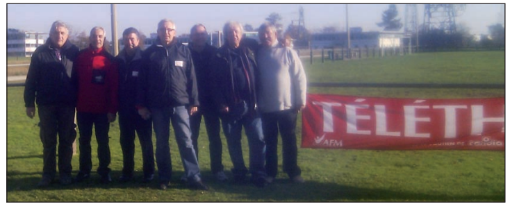
Les membres qui ont participé au Téléthon.