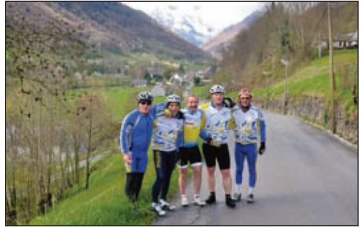
Une belle balade pour quelques courageux dans la vallée de Lesponne après avoir participé la veille à la Traversée des Baronnies dans les Pyrénées.

Hors département, nous avons honoré de notre présence la