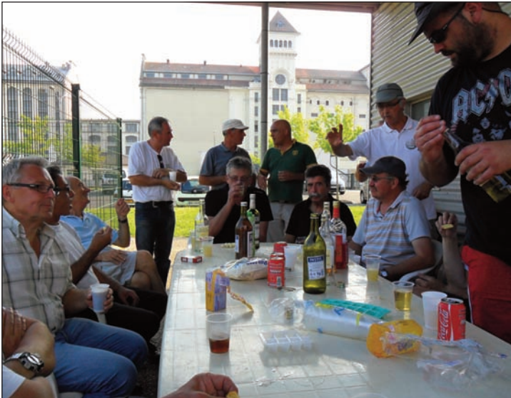
La détente après quelques parties acharnées.

décrits en partie ci-dessus et adapter notre niveau d'implication dans l'organisation de la rencontre Inter-Pro ainsi que la réception de clubs en fonction de notre budget. La priorité sera notre participation aux événements habituels, voire plus, mais elle sera principalement axée sur la mise en valeur de nos infrastructures.