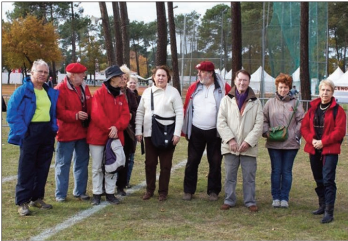
Marcheurs au cross Sud Ouest