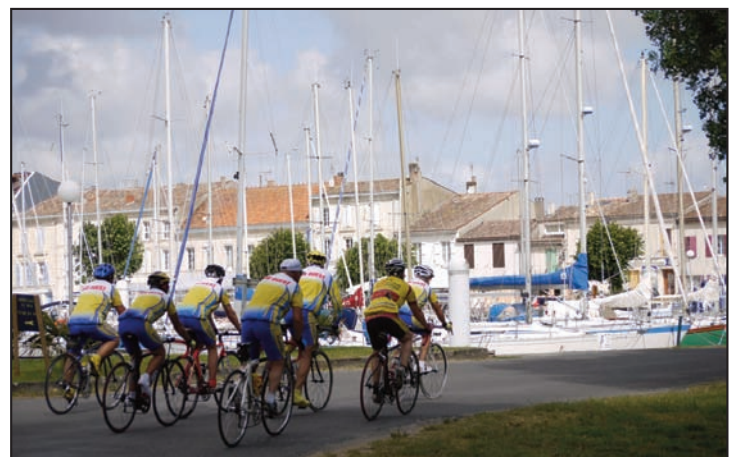
Lors du Tour de l'estuaire en juin, le passage au très pittoresque port de Mortagne.