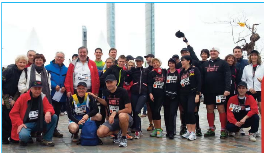
L'équipe SUD OUEST à la course des Ponts

!SINON LES PONTS! TOUTS SUR LES PONS SNOT