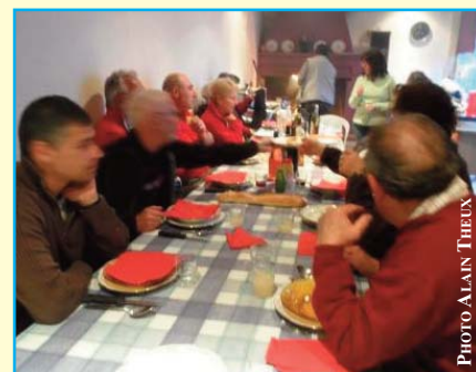
Qu'ils sont sages... !