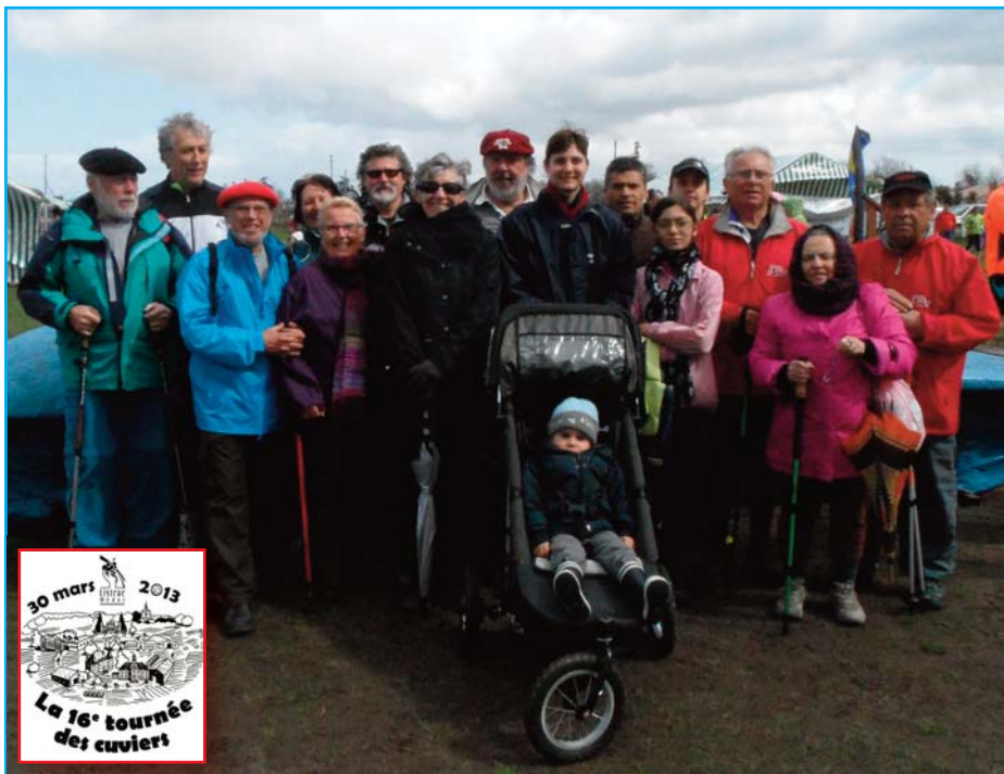
Le groupe à Listrac

Commentaires et mise en page : JLGB Coordination : Agostinho Participante : Florence Nidos