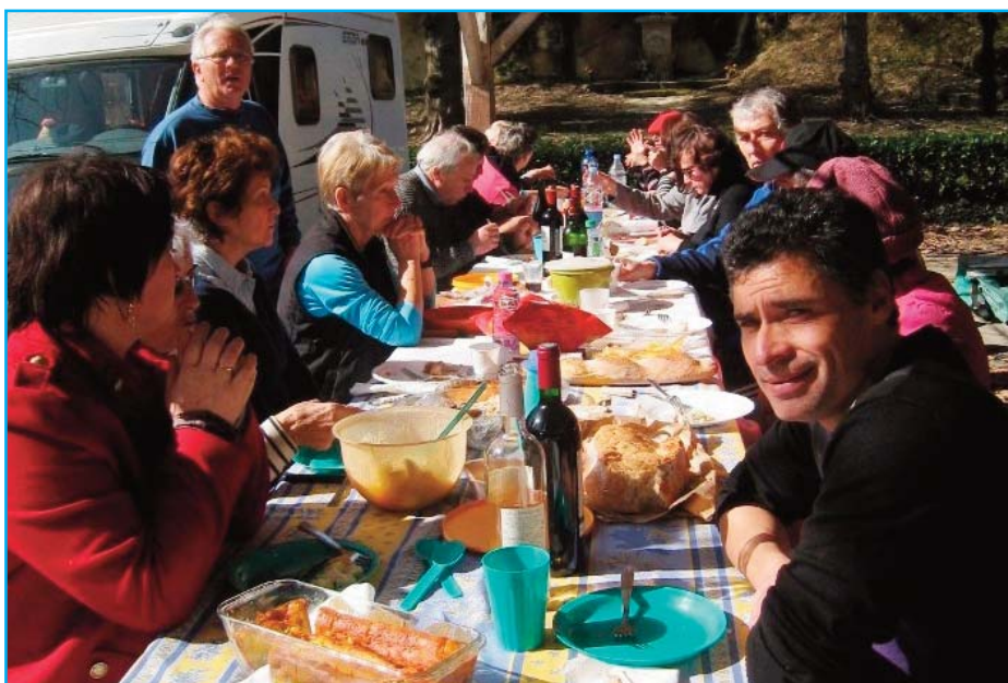
Le traditionnel repas du Pas-de-la-Mule à Verdélais