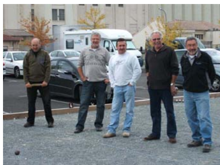
16 octobre 2010, lors de la réception du CHR...

améliorations possibles d'un club suivi d'une confrontation amicale jusqu'à 18 h. Quinze représentants motivés du CHR ont foulé et étu-