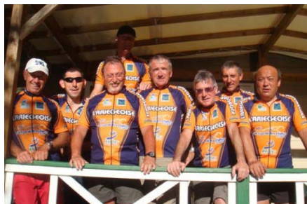
Les huit adhérents présents à l'Ariégeoise fin juin, aux couleurs de l'épreuve

Par contre, net essoufflement des cyclosporives, la section n'étant représentée que sur