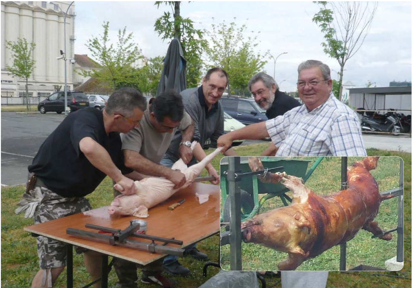
Préparation du cochon de lait.

membres s'investissent sérieusement dans chaque projet. Régularité aux entraînements du jeudi avec une moyenne de 30 joueurs qui symbolisent un excellent état d'esprit pour une convivialité de tous les instants. L'espace vital devenant restreint et les demandes nombreuses, nous n'accorderons pas de nouvelles licences extérieures pour cette année.