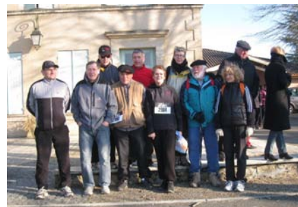
L'équipe de marcheurs sur Coimères/Langon

Les lieux d'entraînements collectifs du jeudi se déroulent aléatoirement aux antennes