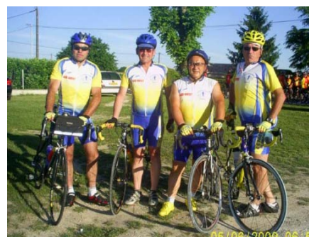
Les quatre participants au Tour de Charente cyclo-touriste sur deux jours au départ le samedi matin.

En VTT, les pionniers ont fort bien montré la voie et fait des émules puisque pas moins de six adhérents étaient présents aux randos de Quinsac et Créon et cinq à celle de Beautiran. Et cette activité devrait encore plus s'intensifier en cette année 2011