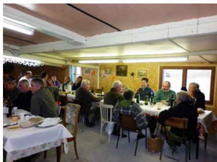
Repas au Blayais.

En cette ouverture de la saison, 36 personnes étaient au rendez-vous du « Blayais » à Pessac et malgré une température estivale, nous avons pu laisser nos chiens galoper et nous procurer de splendides arrêts. La chaleur eut, malheureusement, très vite rai-