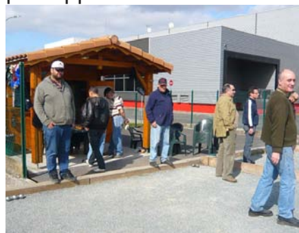
A l'approche de 14 h, les premiers arrivés testent le terrain.

L'apport de l'électricité nous a permis de rapatrier aujourd'hui l'essentiel de notre équipement dans le chalet. Celui-ci est équipé de frigidaire, micro-ondes, cafetière électrique. Un chauffage électrique nous permet de ne plus appréhender les frileuses