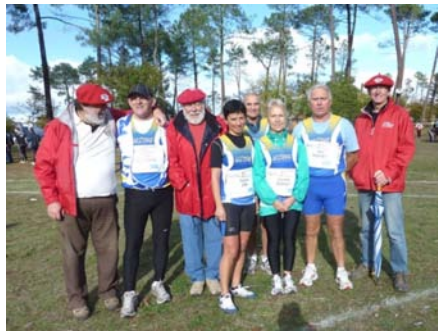
Les partants au Cross du SO.

décrassages..., des rassemblements conviviaux autour d'un verre, d'un casse-croûte ou d'une festoyade ont su nous retenir à Bassens, Listrac, Verdelaïs, Moulis, Azay, Bourg, Sadirac et Arcachon, sans oublier notre coup de pouce à l'organisation de la jour-