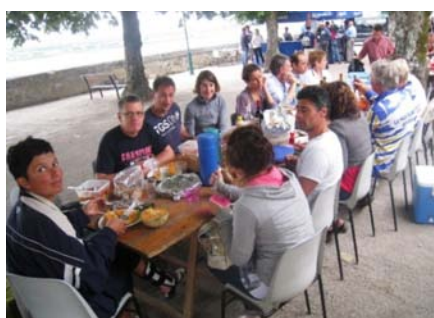
Repas d'après course près de Bourg-sur-Gironde avec visite guidée du moulin de Lansac

d'athlètes fidèles se sont alignés sur plus de 10 courses, même si une dizaine d'autres n'est venue qu'une seule fois, malgré les stigmates du sprint des derniers mètres lors de certaines arrivées, tous l'ont fait avec plaisir et sont prêts à recommencer.