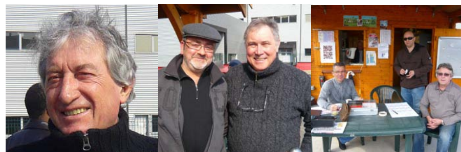
16 octobre 2010, lors de la réception du CHR...

Si l'invention de la pétanque reste relativement récente, on peut faire remonter le "jeu de boules" aux loisirs des plus hautes civilisations