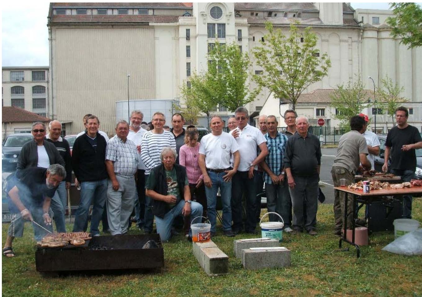
La convivialité permanente de la section pétanque...