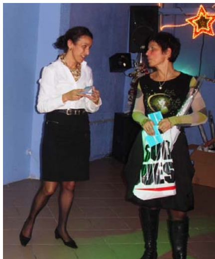
Remise des prix aux premiers des Challenges.

Concernant nos challenges internes « Performance » et « Participation » élaborés à l'aide des fiches individuelles récapitula-