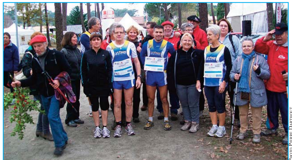
Coueurs et marcheurs au cross Sud-Ouest de Gujan