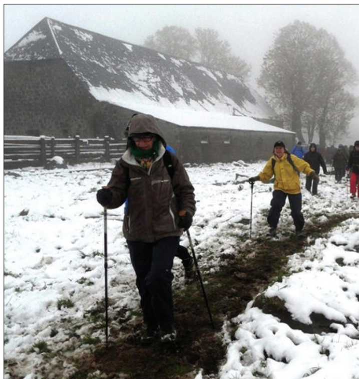
Le Cantal et ses caprices n'ont découragé ni les coureurs ni les randonneurs