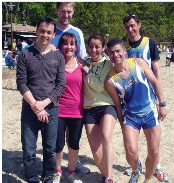
Notre équipe mixte qui a bouclé le marathon en relais en 2 h 50 min !