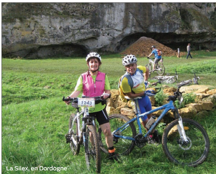
La Silex, en Dordogne

La grande satisfaction fut la reprise de l'activité VTT, dynamisée par l'arrivée de nouveaux adeptes des roues cramponnées sur des chemins boueux qui ont porté les couleurs jaune et bleu dans sept endroits différents. Dont notamment à la très difficile (mais la plus belle de la région) Rando Silex de Saint-