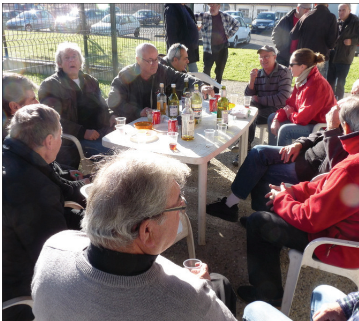
Un apéritif du 7 décembre 2013

La saison 2013 s'achève, sans répit, pour croquer à pleines dents une nouvelle saison et, toujours sous le signe de la bonne humeur et de l'amitié. Malgré des journées rendues souvent délicates, voire inconfortables, dues aux multiples aléas météorologiques de l'année écoulée, peu propice aux sports d'extérieurs. Mais le plaisir de se retrouver pour