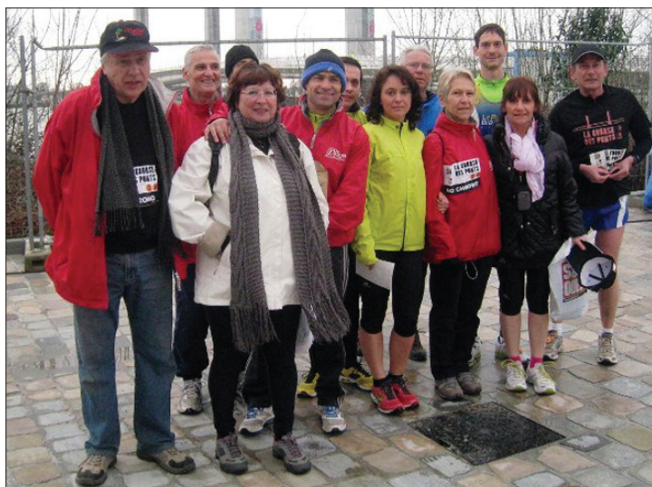
Participation en nombre à la 1 re édition de la Course des Ponts de Bordeaux