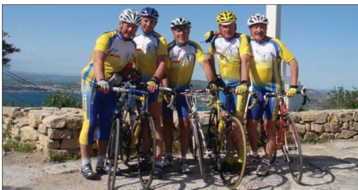
Au sommet du mont Saint-Clair pour la Bordeaux-Sète

Nos activités sur le blog : ccpb.blogs.sudouest.fr