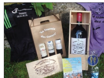
Une remise des prix de qualité remportée au challenge du nombre course et rando à Listrac

première édition l'an passé mais une dizaine de fidèles étaient bien présents et ont à nouveau effectué tout le parcours de 6 km ensemble réalisant notamment deux podiums féminins et tous déguisés !